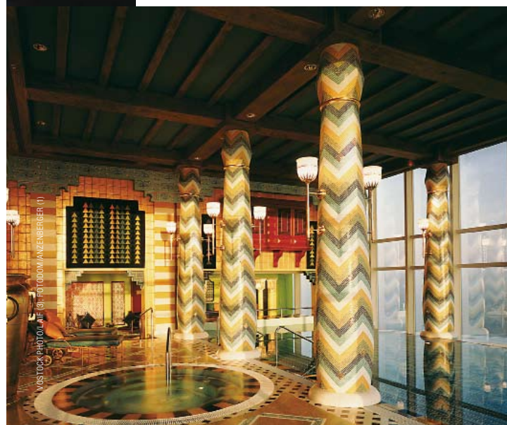
БАССЕЙН INFINITY, BURJ AL ARAB.

ВВЕРХУ: ТЕРРАСА СПА-ЦЕНТРА TALISE SPA, MADINAT JUMEIRAH. ВНИЗУ: КОМНАТА ДЛЯ ПРОЦЕДУРЫ ALPHASPHERE DELUX, MADINAT JUMEIRAH