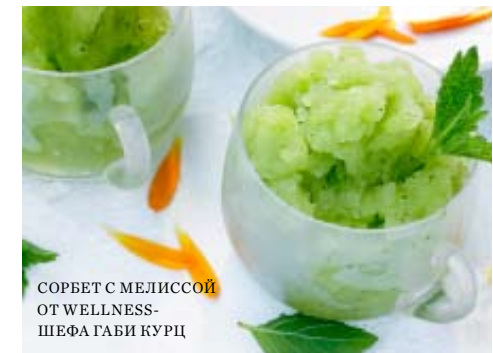
СОРБЕТ С МЕЛИССОЙ ОТ WELLNESS-ШЕФА ГАБИ КУРЦ

каждый гость может ограничиться легкими и полезными закусками из меню спа-центра или в течение всего отпуска оздоравливаться блюдами «от шефа Габи» – а они найдутся во всех ресторанах отелей Jumeirah. При этом каждая позиция в меню Talise Nutrition, будь-то витаминный смузи, суп или горячее блюдо, помечена значком, указывающим на wellness-свойства. Что-то может быть особенно полезно для кожи, что-то для вывода токсинов или похудения. Кроме того, вы можете записаться на индивидуальную консультацию с Габи или посетить ее мастер-классы – чтобы увезти ценные рецепты и полезные навыки с собой домой.